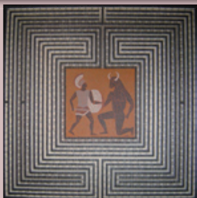
Thésée (en grec ancien Θησεύς / Théseús) combattant le Minotaure dans le labyrinthe.

Dédale (en grec ancien Δαίδαλος / Daídalos, adjectif signifiant "artistement travaillé", "l'Astucieux") est un personnage de la mythologie grecque, un Athénien, descendant de la famille royale issue de Cécrops. Il est principalement connu pour être un inventeur, un sculpteur et un grand architecte, alliant génie esthétique et ingéniosité technique et pour avoir notamment conçu le labyrinthe pour enfermer le Minotaure.